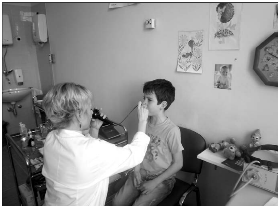
Slika 2. Fiberoskopski pregled nosa i nosnog ždrijela

Podatke o SDB u djece dobivamo heteroanamnestički. Roditelji navode da dijete hrče i opisuju klasičnu kliničku sliku apnejičke faze karakterizirane prekidom disanja od nekoliko sekundi koja završava velikim udahom sa ili bez buđenja djeteta. Navode i kako dijete nemirno spava te se pojačano znoji što rezultira razbacanom i vlažnom posteljom te pospanošću ili hiperaktivnošću