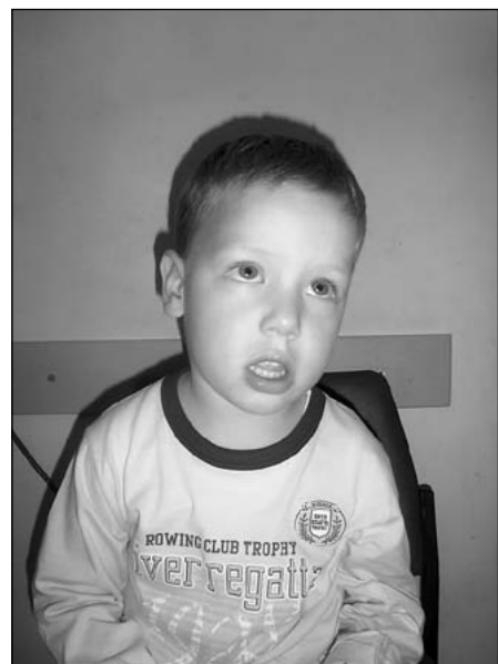
Slika 1. Facies adenoidea

imaju i brojne druge smetnje: noćno mokrenje, prekomjerno znojenje, poremećaj pažnje i koncentracije, poremećaje ponašanja te usporeni tjelesni rast i razvoj (2-5). U najtežim slučajevima teškoće se mogu očitovati epizodama apneja u snu koje se periodički izmjenjuju s epizodama hrkanja i gušenja koje mogu dovesti do kronične hipoventilacije, hiperkapnije i hipoksije s razvojem plućne hipertenzije i plućnog srca (6).